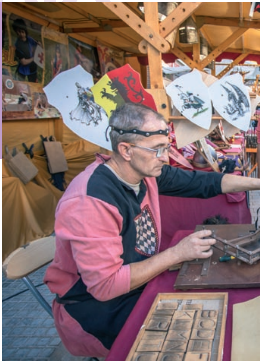
Els visitants han pogut veure demostracions de diferents oficis de l'època medieval