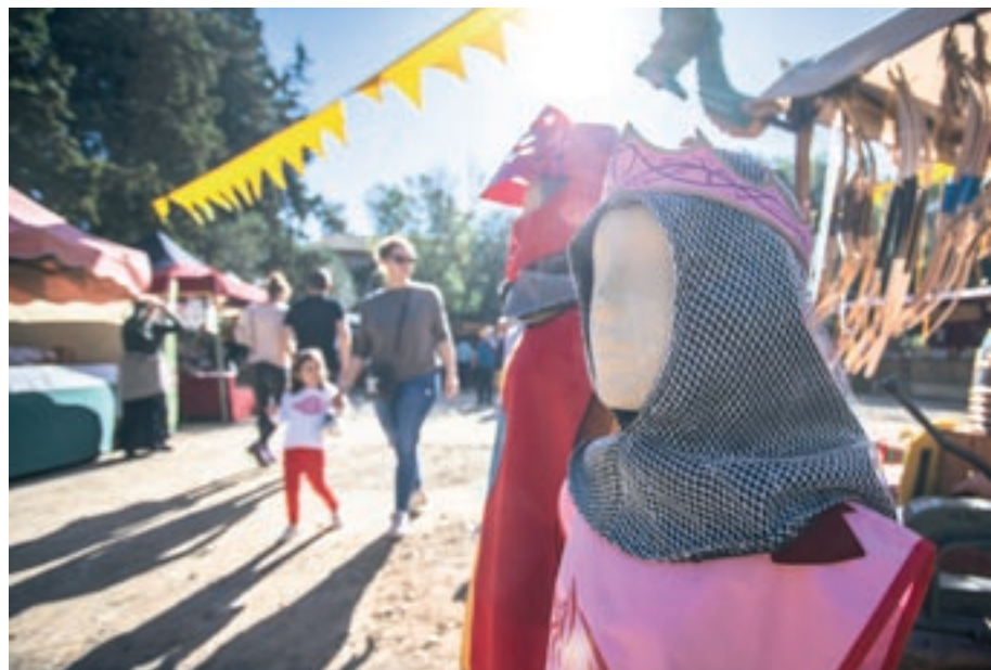
L'ambientació medieval ha estat una constant durant tota la festa