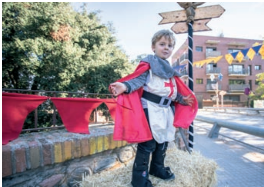
La festa implica petits i grans